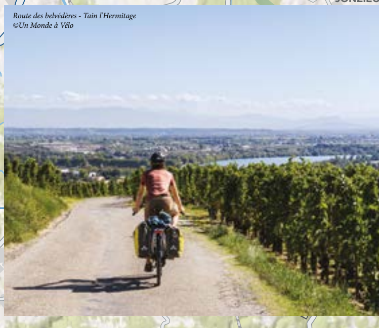
Road des Médières - Tain l'Hermitage